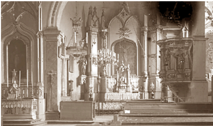
Ołtarz główny z 1870 roku (zdjęcie wykonane w 1908 roku).